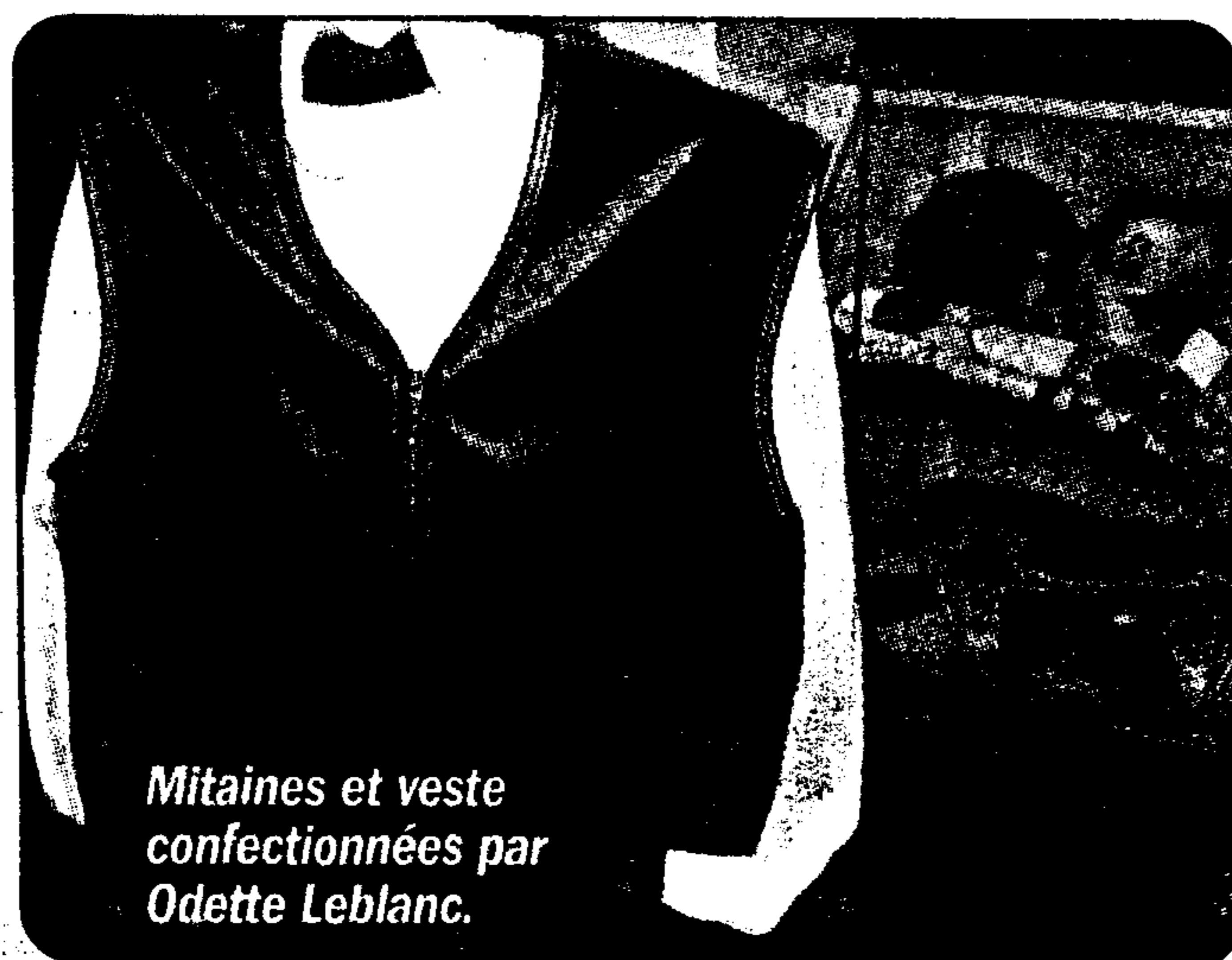
Mitaines et veste confectionnées par Odette Leblanc.