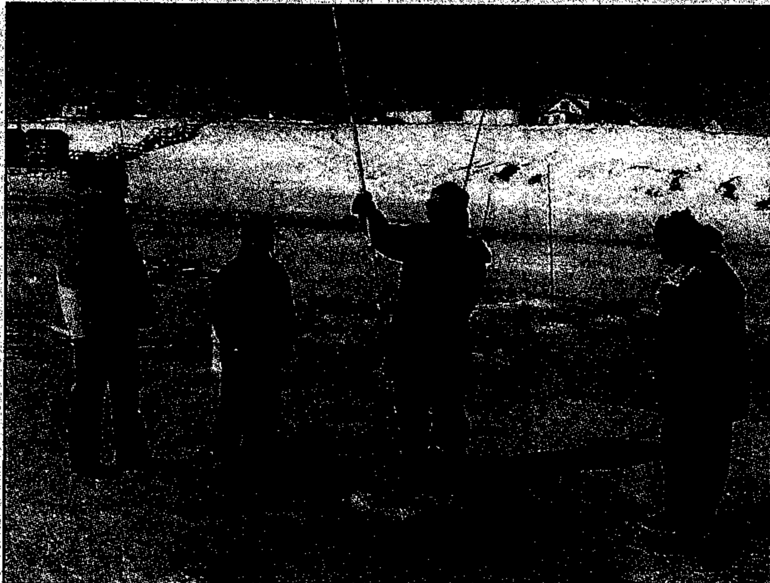
Une démonstration de pêche à l'anguille qui fut très appréciée.

Dans l'ensemble, il s'agissait de la présentation de plusieurs activités en collaboration avec la direction de l'aquarium afin de faire connaître à tous ceux qui ont visité ces lieux, la belle richesse de notre histoire, de nos traditions et aussi de la faune qui entoure les Îles à chaque printemps, c'est-à-dire le loup-marin. Comme le beau temps s'était mis de la partie, la foule n'en fut que plus nombreuse et c'est avec grand plaisir que de nombreux visiteurs ont pu goûter aux différents délices et coutumes qui font un peu partie de nous mais que nous oublions trop souvent.