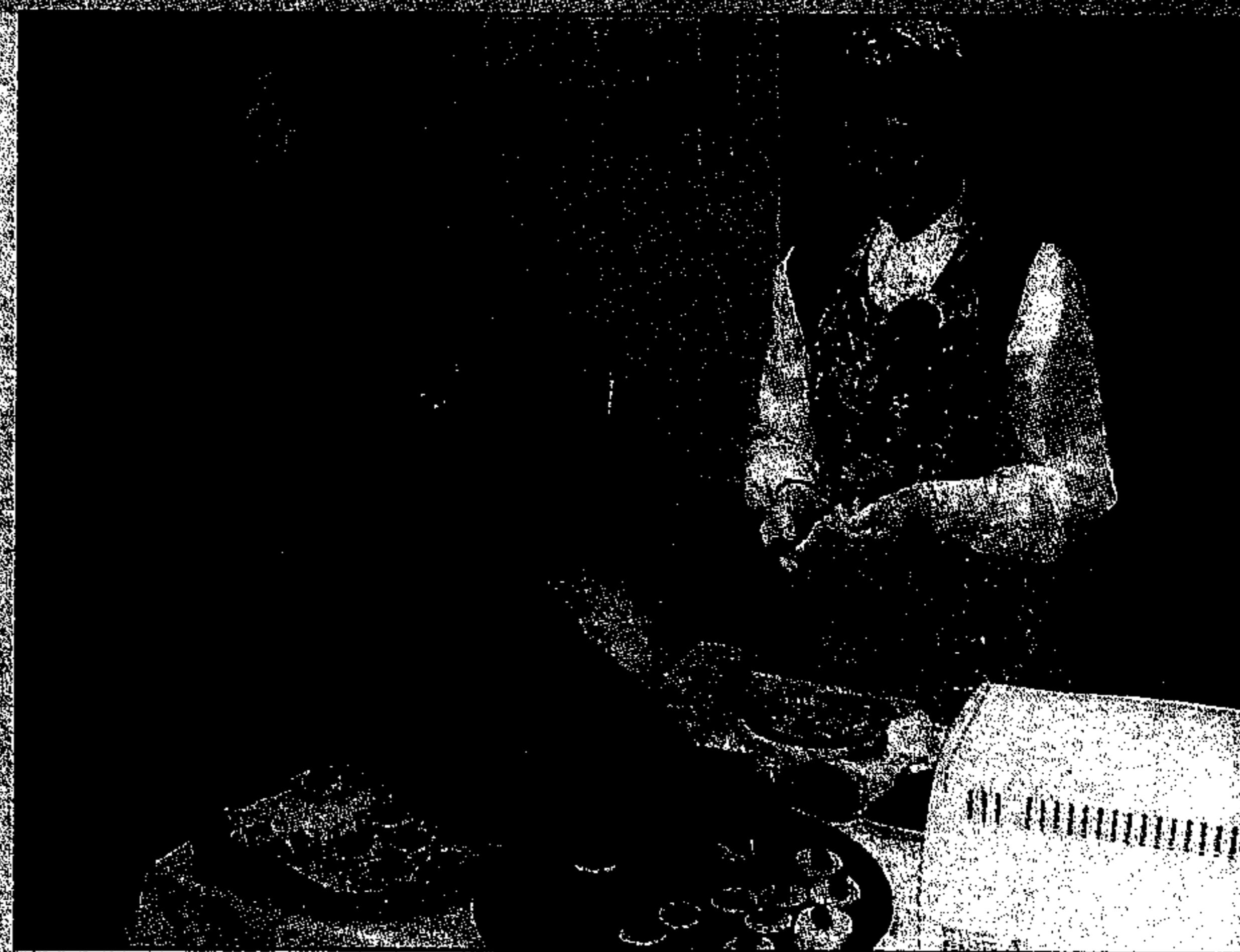
Une table de dégustation des différents produits de la viande de loup-marin ainsi qu'un comptoir de « croixnoles » ont fait fureur tout au long de l'après-midi.

Pendant tout l'après-midi, on a pas cessé de démontrer aux gens comment se fabrique un harpon à anguille et ce devant petits et grands qui n'étaient jamais fatigués de l'observer et surtout de poser de nombreuses questions.